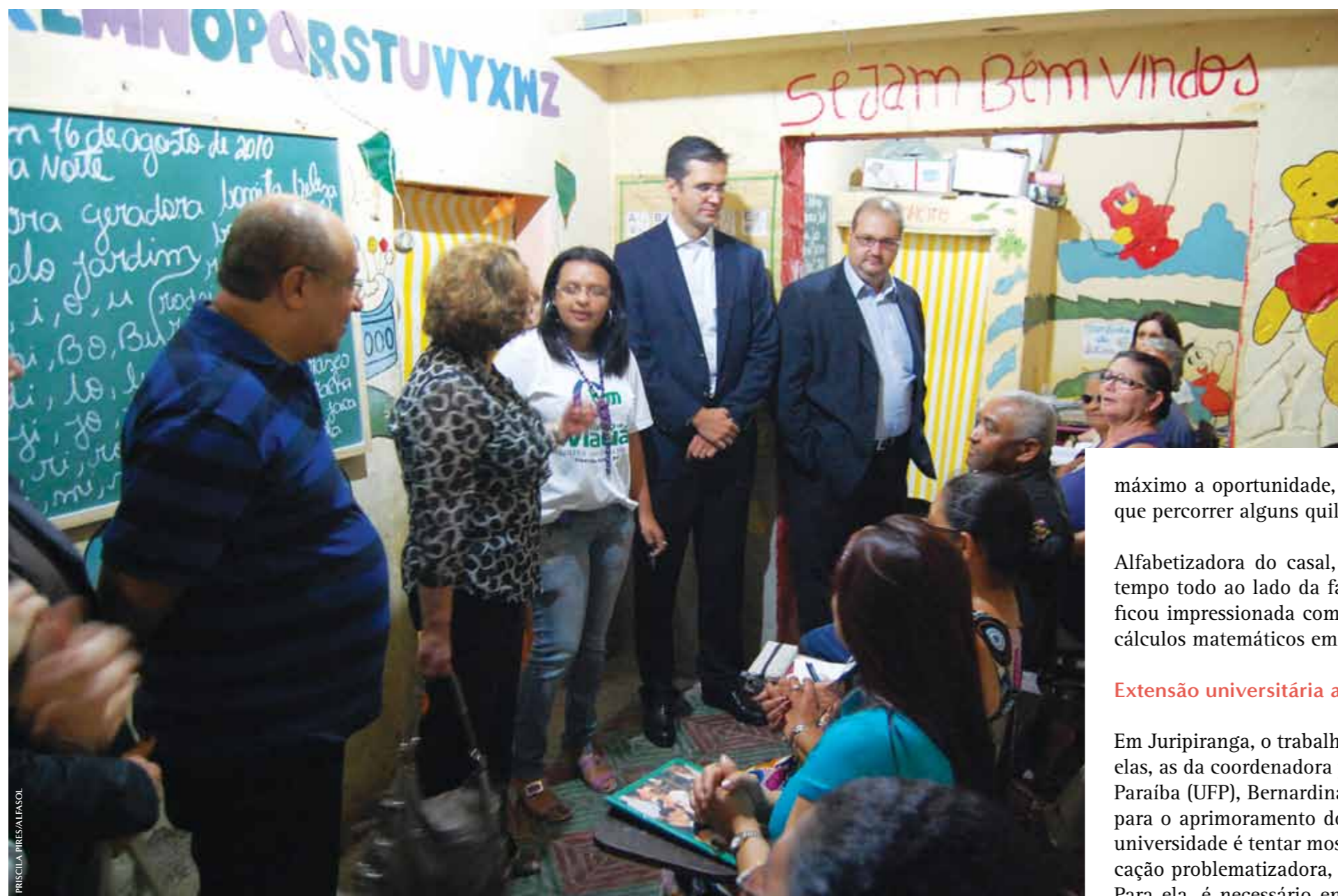
Representantes da AlfaSol, Philip Morris e CDI em visita à sala de aula Recanto Vó Lozinha, na pernambucana Belo Jardim

máximo a oportunidade, e todas as noites frequenta as aulas, mesmo tendo que percorrer alguns quilômetros de bicicleta até a escola.