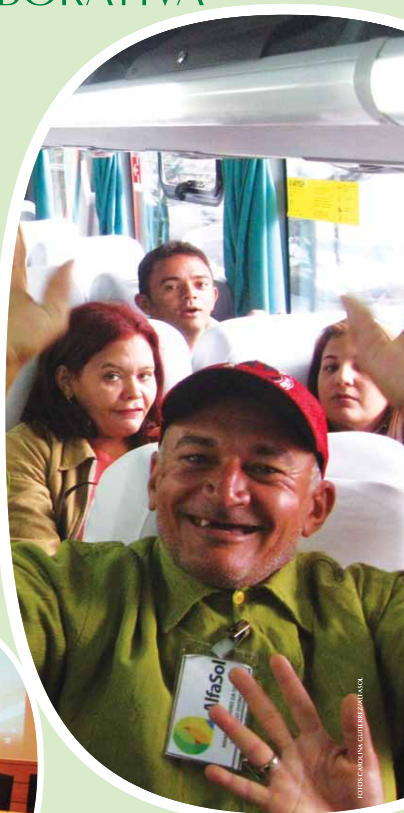
Alunos e alfabetizadores em viagem ao Complexo Industrial Automotivo da GM, em São José dos Campos