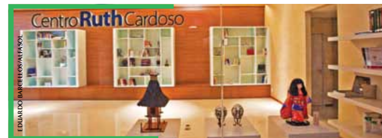
O Centro Ruth Cardoso tem acervo e área destinada à pesquisa e estudo

O Centro passa a ocupar uma área de 250 m 2 no térreo do Edifício Ruth Cardoso, que também abriga as outras Organizações criadas por sua titular – o ArteSol, a Comunitas e o UniSol –, além da AlfaSol, mantenedora do espaço. Com uma área destinada à pesquisa e estudos relacionados à temática social e à obra da antropóloga, o Centro abriga um acervo bibliográfico e objetos que representam a passagem de Ruth Cardoso pelas Organizações que criou e como primeira-dama do Brasil. Na entrada, os visitantes deparam com um painel de sete metros de largura, com cerca de 1.500 fotos dos projetos idealizados pela antropóloga.