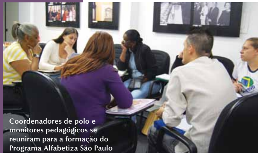
Coordenadores de polo e monitores pedagógicos se reuniram para a formação do Programa Alfabetiza São Paulo