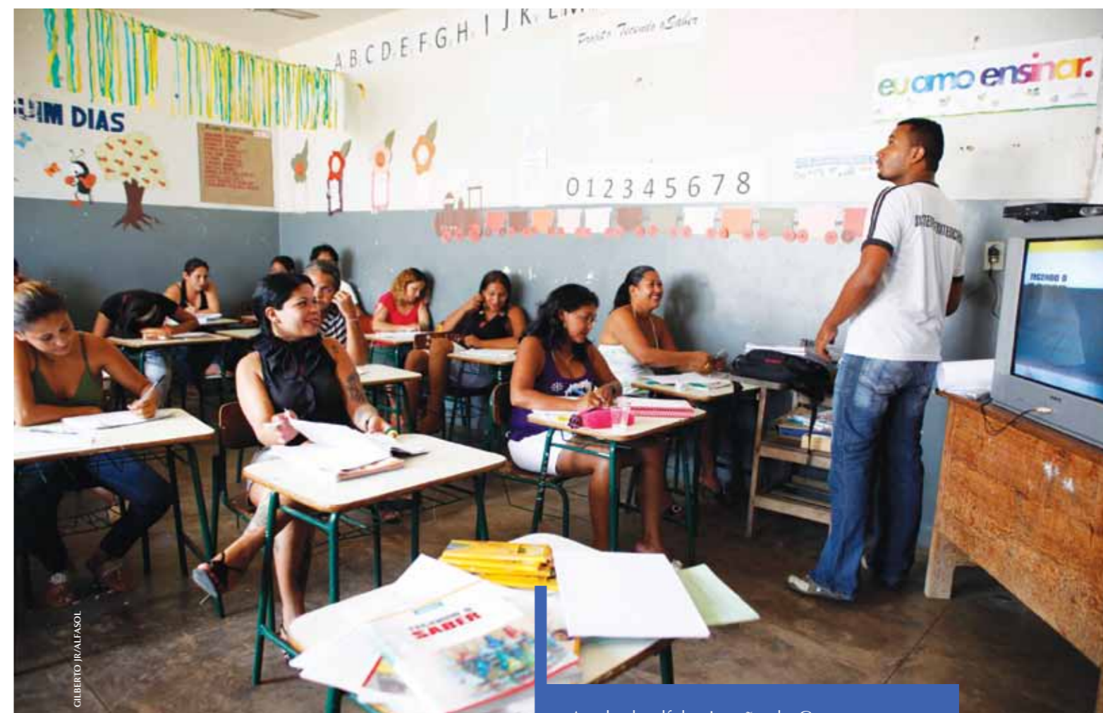
Turma atendida no Centro de Recuperação Agrícola Mariano Antunes