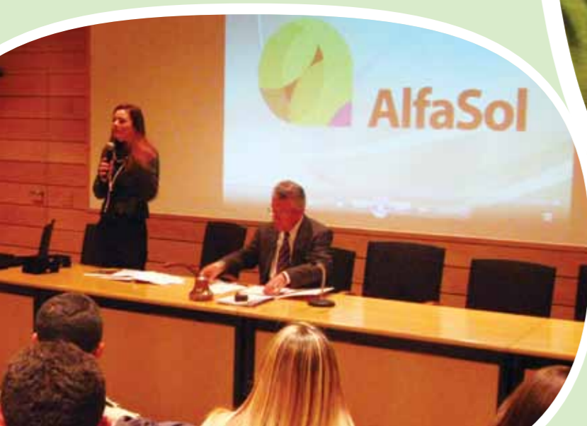
Na Abrac, a AlfaSol e o Instituto General Motors celebraram a renovação da parceria

Mais de 5,5 milhões de alunos atendidos e 257 mil alfabetizadores capacitados em 2.205 municípios espalhados pelos mais diversos cantos do Brasil. Números resultantes do trabalho conjunto realizado entre a AlfaSol e uma extensa rede de parcerias em diferentes setores da sociedade.