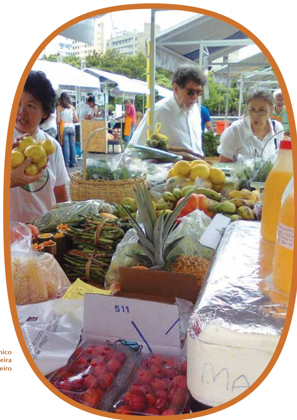
Grupo do SerOrgânico comercializa produtos em feira da Lapa, no Rio de Janeiro