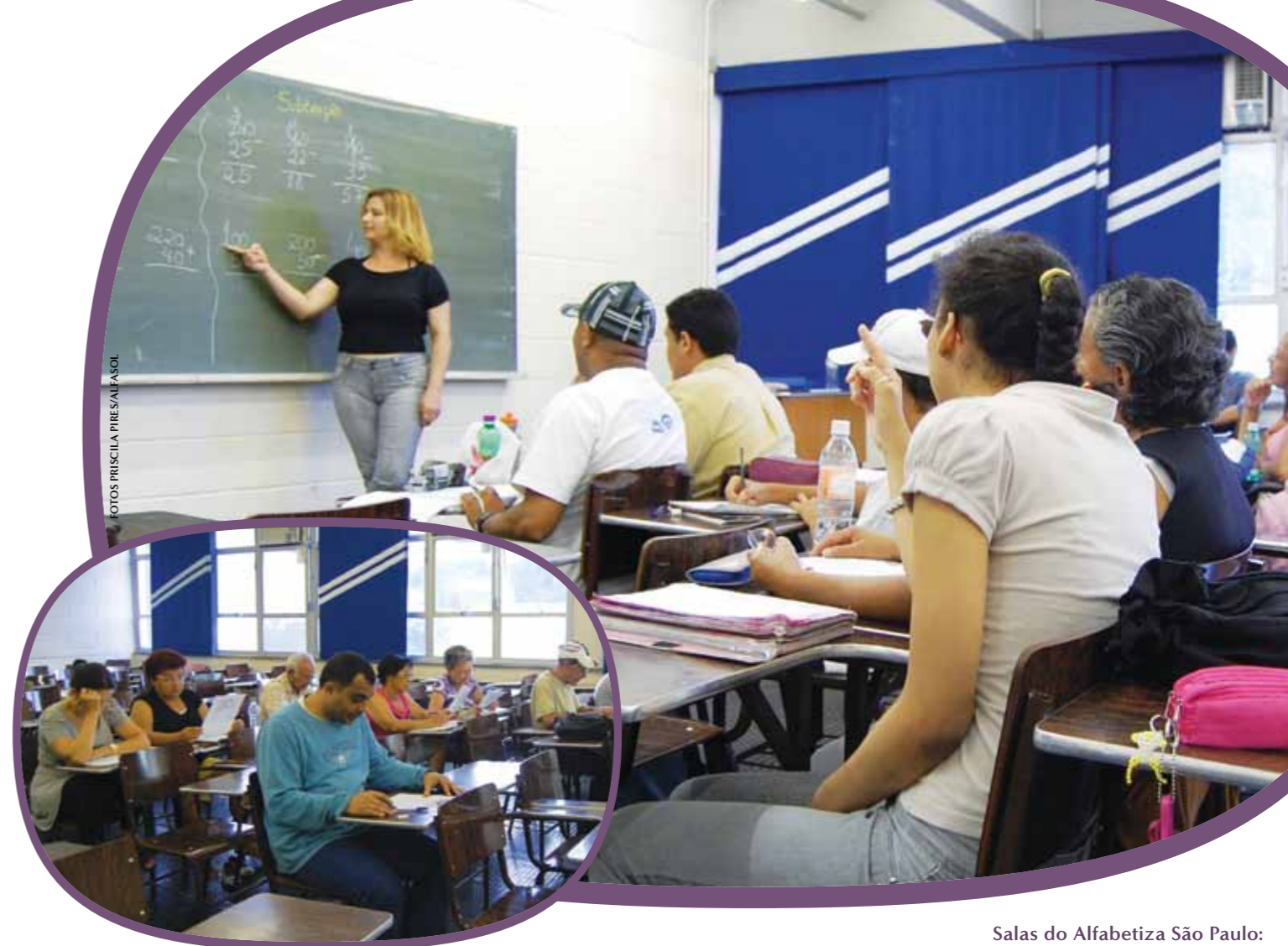
Salas do Alfabetiza São Paulo: a cada aula uma conquista e uma experiência diferente

“Nunca saio da sala de aula do mesmo jeito que entrei. Todos os dias os meus alunos me ensinam algo novo sobre a vida, sobre acreditar em si mesmo,