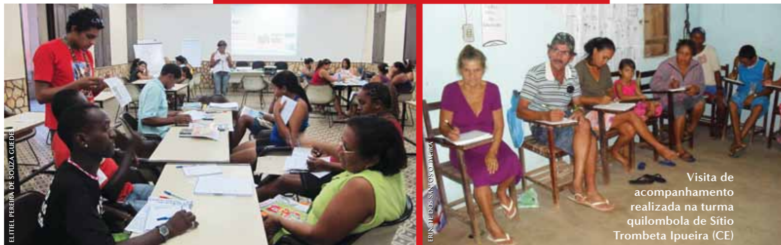
Visita de acompanhamento realizada na turma quilombola de Sítio Trombeta Ipueira (CE)

Educadores dos movimentos Quilombolas, MST, GMAIS e FETRAECE em formação continuada realizada em Caucaia (CE)