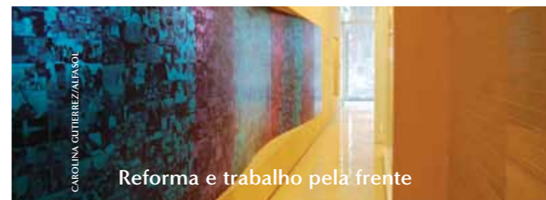
Reforma e trabalho pela frente

O evento de cerca de 200 pessoas foi conduzido pelo ex-jogador de futebol Raí de Oliveira, e teve a mesa composta pelo ex-presidente Fernando Henrique Cardoso; pelo então governador do Estado de São Paulo, Alberto Goldman; o prefeito Gilberto Kassab; e pelo escritor Ignácio de Loyola Brandão, além do professor Castells.