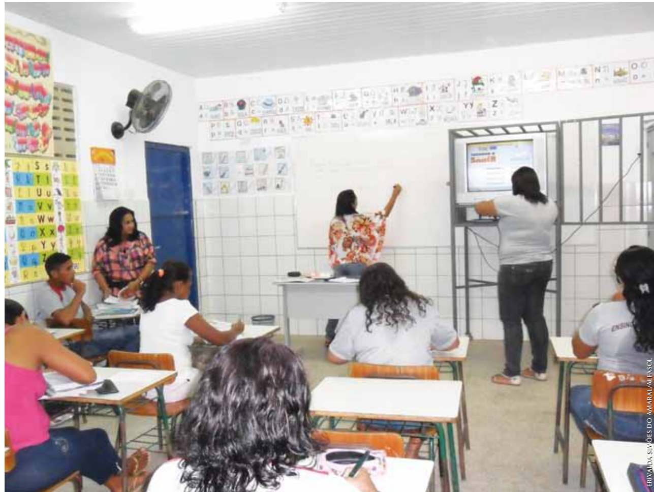
TeleSol em Teresina: modelo vencedor do Prêmio Piauí de Inclusão Social