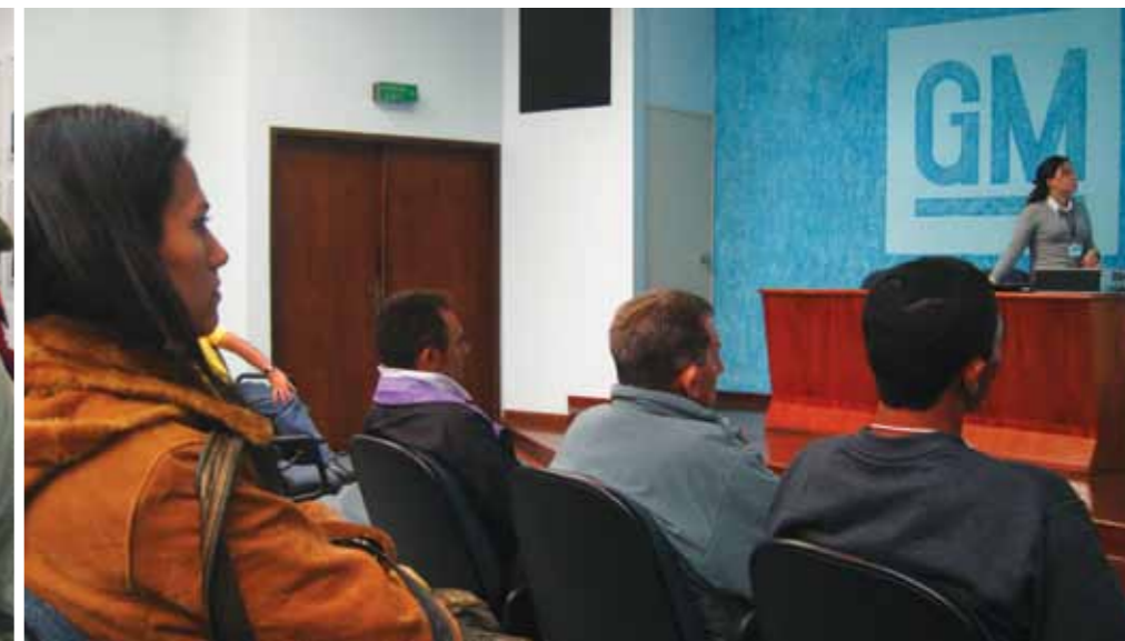
Em dois anos de atuação, o Programa Rede Chevrolet de Educação Solidária já atendeu 12 mil alunos