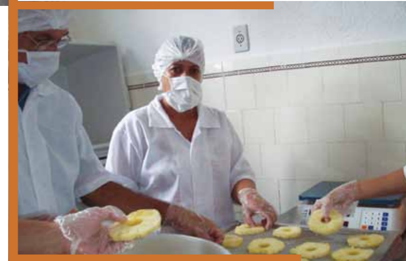
Capacitação e produção na sede da agroindústria do Sabor do Tinguá

tornou-se um empreendimento social sustentável, totalmente gerenciado e mantido pelas ações do grupo.