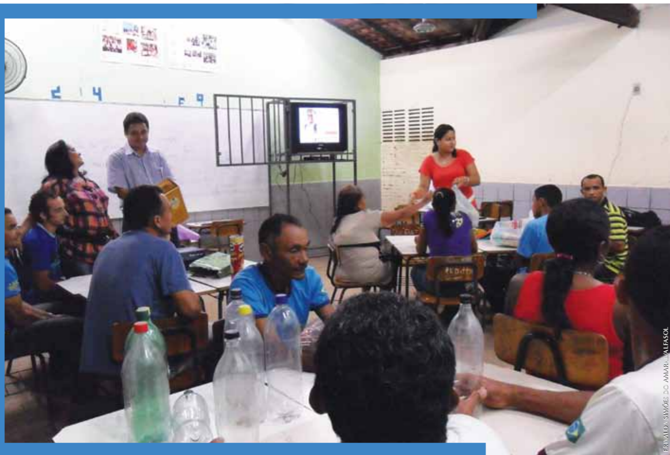
Turma do 2º segmento do TeleSol na escola municipal Joca Vieira, na zona rural de Teresina